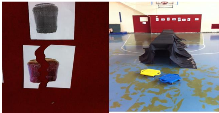
חלקי פזל שהיו במנהרות

המשימה: התלמידים יתקדמו לעבר המנהרה בשכיבה על משטח גלגלים. יכנסו למנהרה בזחילה ובסוף המנהרה יציאו מתוך הסלסלה חלקי פזל שבסופו ירכיבו מס תמונות של שרידים ארכיאולוגים שנמצאו בעיר.